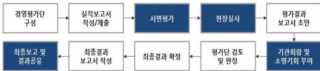
[ 경영평가 수행 주요 Process ]