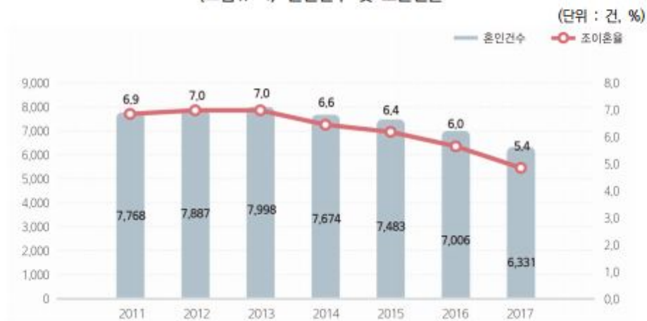
〈그림 II-4〉 혼인건수 및 조혼인율

자료 : 통계청, 「인구동향조사」, 동남지방통계청, 「2017년 울산광역시 고령자통계」.