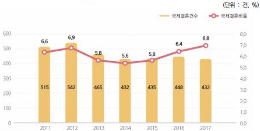
〈그림 II-5〉 국제결혼건수 및 비율