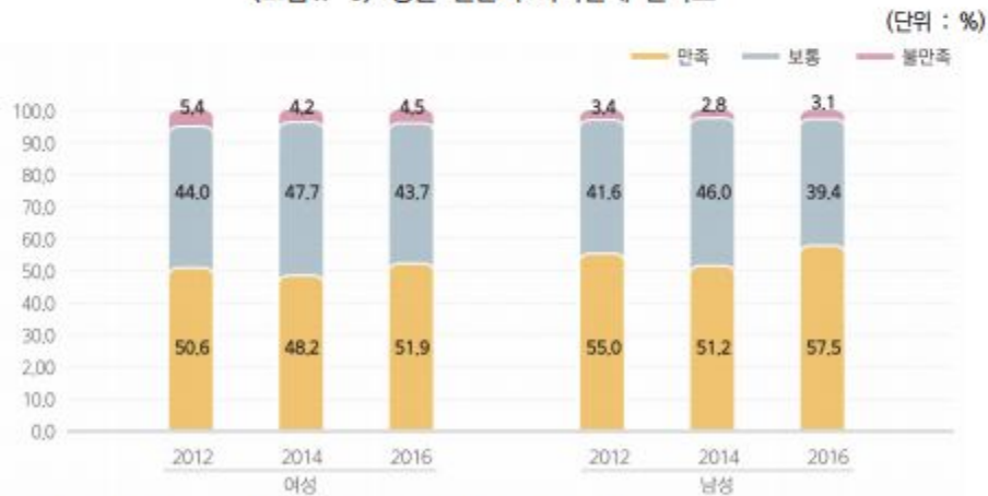
〈그림 II-8〉 성별 전반적 가족관계 만족도

주 : 만족 = 매우 만족 + 약간 만족, 불만족 = 약간 불만 + 매우 불만.