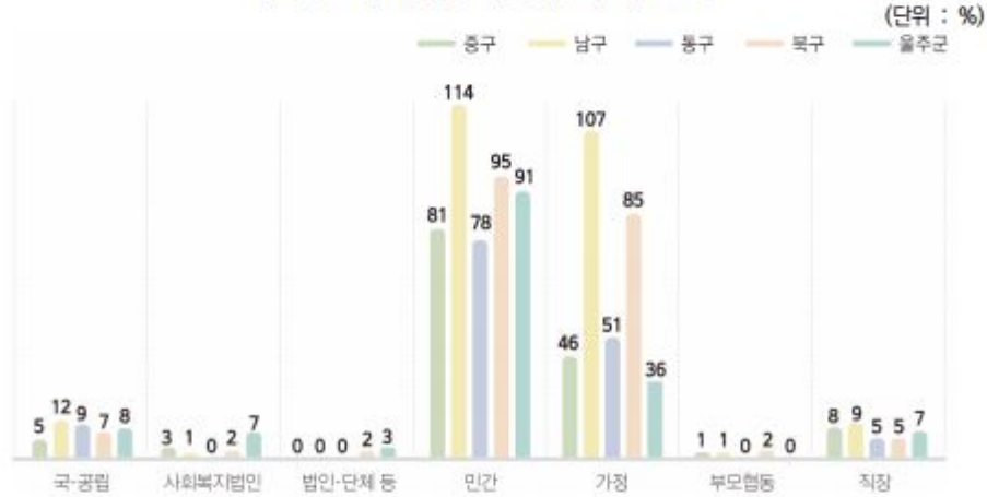
〈그림 III-2〉 유형별 어린이집 수 (2017)